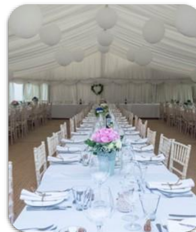
Salones de banquetes